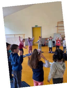
Tanzprojekt mit der Tanzschule Srutek